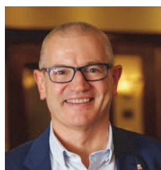
Real Larnou Belgio